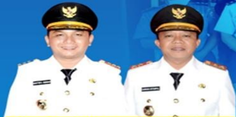
BAKHTIAR AHMAD SIBARANI BUPATI TAPANULI TENGAH

UPDATE DATA PASIEN PADA TANGGAL 28 MEI 2020